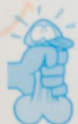
Vegn e Vella