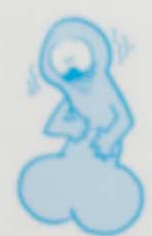
In Forna e gira