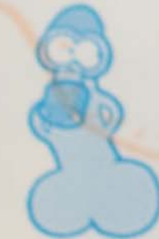
Leon Hard moll