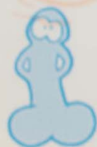
Spizzi e ciapal

Per la conferenza culturale sul tema Gli ultimi uccelli della Valle Bedretto