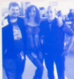
Chie dei due è Rocco Sifredi?

Perchè la mam la insegna che ul panel det bidu congelò us pogia a bas e pò us fa forza col cortel... us tegn mia in man che pò t' sbògi-at!! E ringrazum u Signor che leva mia na giova di nòs...! Gita turistica al pronto soccorso det... Mendris!!! Mia trop a renta quando us trata da emergenza... oltre al danno anche la beffa... lezione imparata!